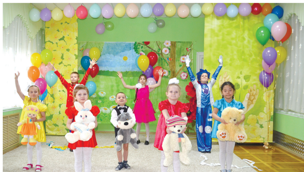
Праздничный концерт «Сказочное детство» в «Добродеи».

1 июня для ребят Центра реабилитации и абилитации «Добродея» по традиции прошел праздничный концерт «Сказочное детство».