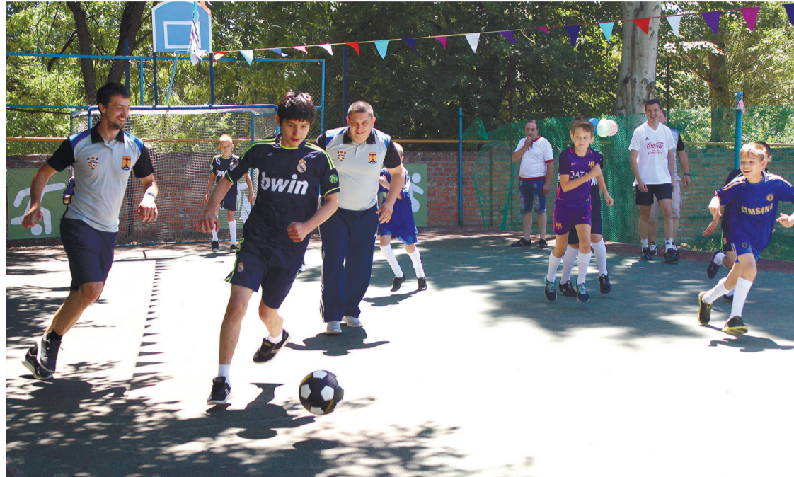
Во время футбола можно испытать и нервное напряжение, и восторг от победы.

Мы сидели за ужином, включили первый попавшийся телеканал - «Матч ТВ». Транслировалась очередная игра, я стал расспрашивать о футболе и внимательно слушал отца. Через какое-то время начал интересоваться футболом, стал поклонником ФК «Ростов» и этого вида спорта в целом. Я очень хотел стать не только болельщиком, но и футбольным комментатором. До сих пор это была лишь мечта, которая могла ею и остаться. Но центр «Добродея» и редакция газеты «Шахтинские известия» предоставили мне возможность сделать эту мечту целью, и